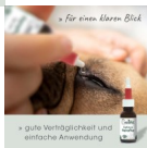
» für einen klaren Blick

» gute Verträglichkeit und einfache Anwendung